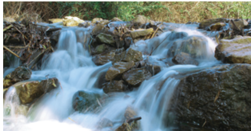
חיבור נחל הדר ונחל הירקון.