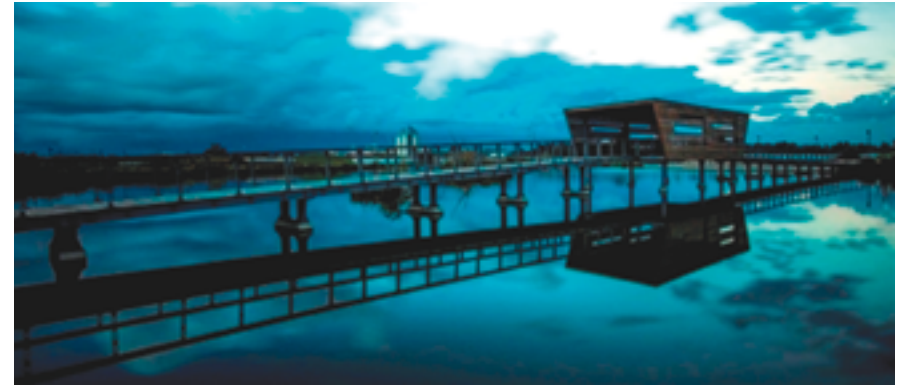
אגם פארק הוד השרון.