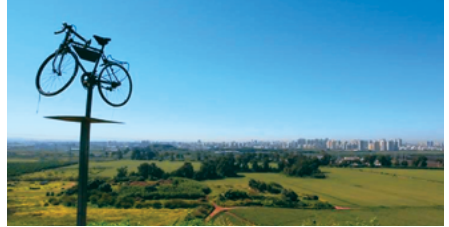
תל קנה תצפית דרומית.