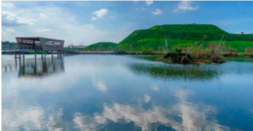
פארק הוד השרון והר הזבל.