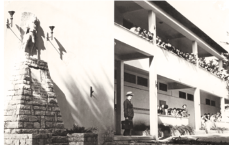
בית הספר ממלכתי א'. שנות ה-40