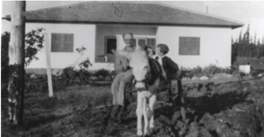
תל דן, 1941