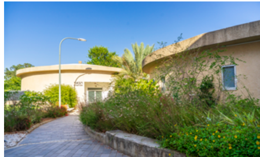
מתחם גבעת הכיבוש