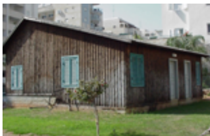
צריף הראשונים. אז והיום