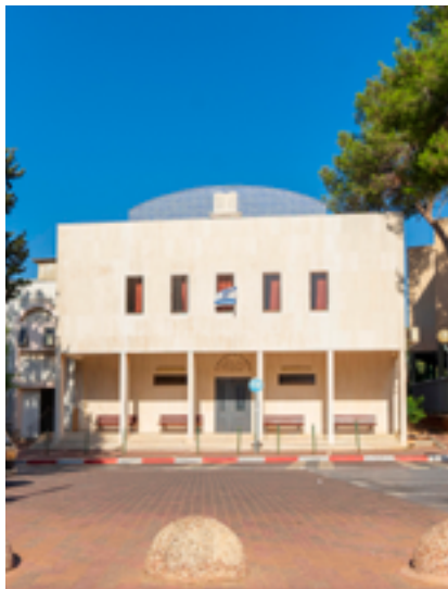
בית הכנסת עדת שלום.