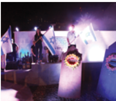
טקס יום הזיכרון בגן הגיבורים

המצבות ויוצרים ציר המסמל את הרכבות שהובילו את הקורבנות לטבח וכך נכתב על גבי האנדרטה: "אנדרטה זו הוקמה לזכרם של ששת מיליוני היהודים שנספו בשואה במלחמת העולם השנייה בשנת היובל לתקומת מדינת ישראל. בעיבורה של העיר הוד השרון, בגן הגיבורים, בדרך המובילה לסמליו הרחניים של עם ישראל: בתי הכנסת שהיו מקור חיותם של היהודים במקום גלותם, ובתי הספר המסמלים את מקור החיים וההמשכיות של קיומו של העם. עץ החורב העתיק שממנו מפכה המעיין הזורם לרגלי האנדרטה, הוא סמלו העתיק של לוחם חרות הרוח ועצמאות הקיום של עם ישראל בעבר, ר' שמעון בר יוחאי, המעיין המפכה הזורם אל האנדרטה של לוחמי עצמאות ישראל - הוא הגשר והקשר בין השואה לתקומה".