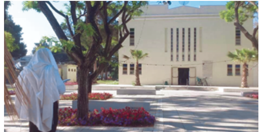
בית הכנסת המרכזי.