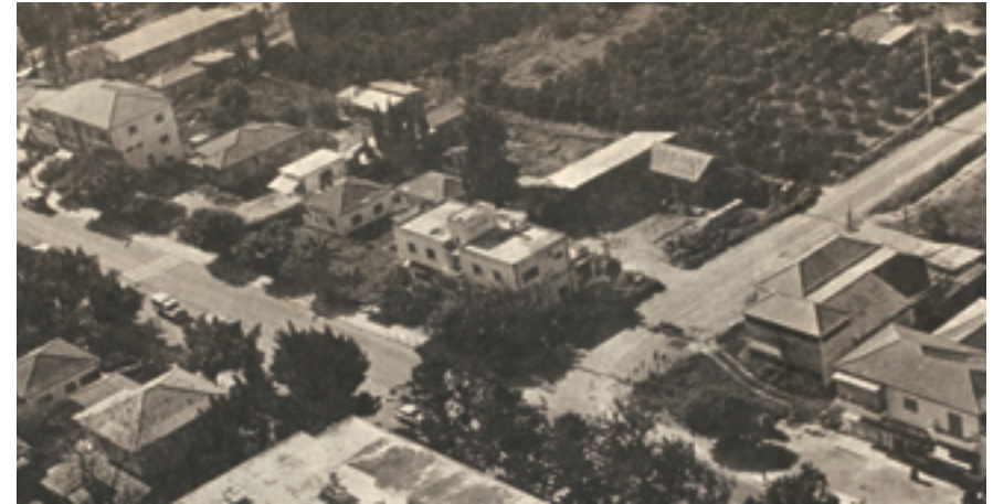
מתחם המושבה שנות ה-80