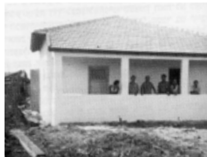
חזית היסטורית מתחם הסילו