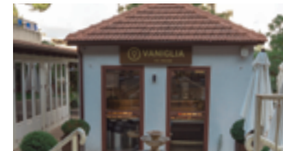
הגלידרייה במתחם המושבה.