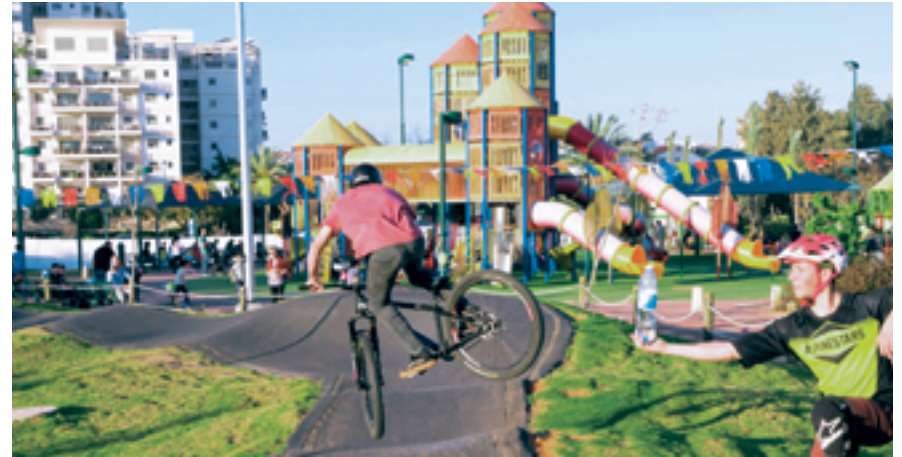
מתחם הפאמפטרק בפארק עתידים, נחנך ב 2018