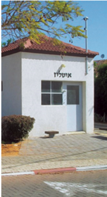
האטליז הראשון בכפר הדר

מבית הנערה נמצא מהיציאה האחורית אל רחוב התכלת. שימו לב כי לא תמיד היציאה פתוחה וכאשר היא פתוחה המעבר מותר להולכי רגל בלבד. במידה והיציאה סגורה יש לצאת אל רחוב הבנים, לפנות מזרחה לכיוון רחוב השקמים. לפנות דרומה לרחוב שקמים, עד לרחוב העבודה ואל החיבור אל רחוב התכלת. ברחוב התכלת נמשיך עד לבית מס' 19 הממוקם מול השלט "ברוכים הבאים לכפר הדר". מתחם כפר הדר הידוע כמכלול ה'סילו' ניצב במרכז ההיסטורי של הדר. המכלול, אשר התפתח בשלבים לאורך השנים, כלל