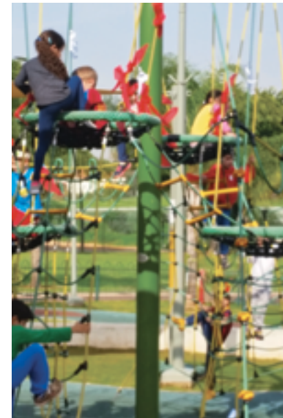
פארק כל הילדים

בשנת 2014 שודרג הפארק על ידי עיריית הוד השרון, במתחם נבנו מספר מתקנים חדישים ומהנים ובחלקו המזרחי הוקם 'פארק כל הילדים' הייחודי, הוא פארק נגיש לילדים וילידים עם צרכים מיוחדים הכולל מתקני משחק ומגרשי כדורסל המותאמים לכולם. בהתאם לחזון העירוני של שילוב וקבלת השונה.