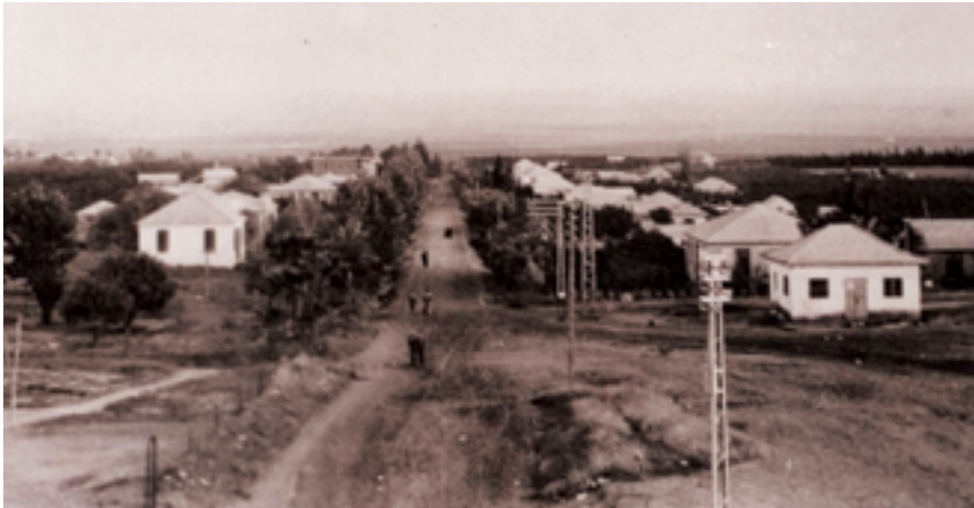
רחוב חנקין בימי ראשית המושבה

במרכזו של הפארק ממוקם שביל מיליון הילדים, המקשר בין רחוב הנשיאים לבין רחוב יאנוש קורצ'ק