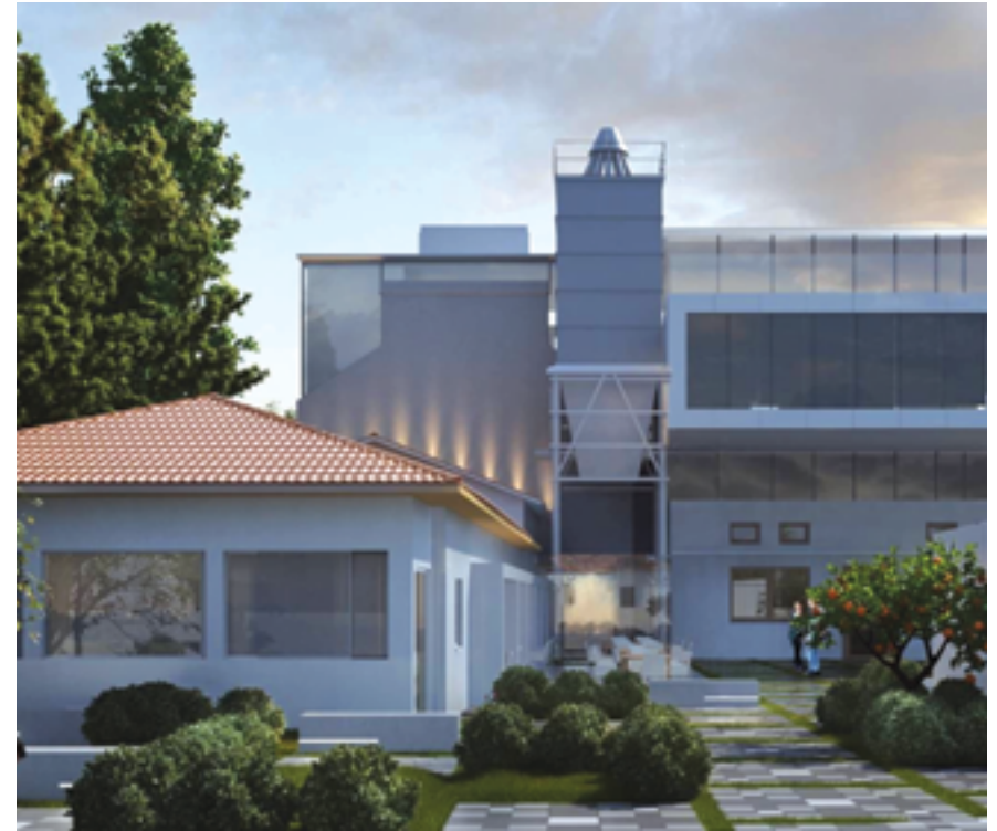
הדמיית מתחם הסילו