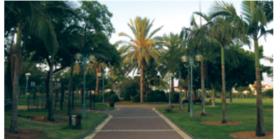
פארק 4 עונות

בניית הבתים נמשכה כתשעה חודשים, ככל הנראה במהלך שנת 1941 והמשפחות שהתיישבו במקום היו פאנו, באקי, גוטסאלה, הרטום, קורינלדי וליאזאדה.