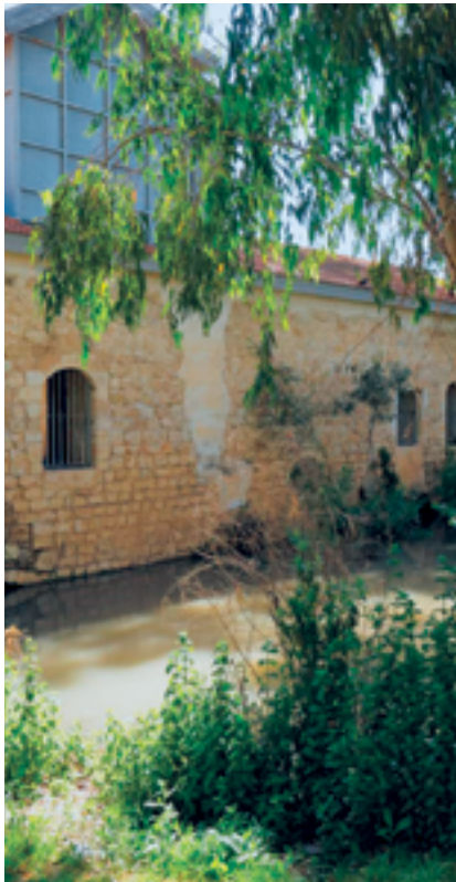
מתחם בית הנערה כיום

בימים אלו עומדת לקראת אישור תוכנית אותה יזמה עיריית הוד השרון במסגרתה נקבע השטח כפארק רחב ידיים ותבוצע בניה רק בשולי המתחם כאשר חלקו העיקרי, לרבות מבני שיפר, בית הנערה, מבנים נוספים ושדרת הפיקוסים ישומרו.