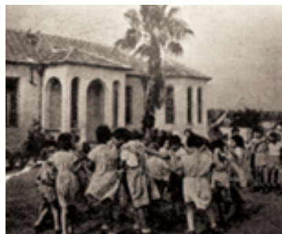
מתחם בית הנערה שנות ה-50

באותה שנה הקימה עיריית תל-אביב מוסד נוסף בשם בית הנערה על כ-30 דונמים בחלקו המזרחי של המתחם. בשטח נבנו מבנים והוכשר מגרש כדורסל. חניכי שני המוסדות למדו ביחד, שאר הפעילויות נעשו בנפרד ושני המוסדות הופרדו פיזית באמצעות גדר. לאורך הגבול בין המוסדות ניטעה שורת עצים והכניסה לבית הנערה הוכשרה מצפון. השטח הפתוח במתחם שיפר הכיל באותה תקופה, מלבד דרכים גם חממה, פינת חי, מטע, פרדס, צמחיית נוי וכן שטחים חקלאיים. שדרות עצים הותרעו לאורך הכניסה הצפונית למוסד העירוני, לאורך הדרך לחדר האוכל של המוסד