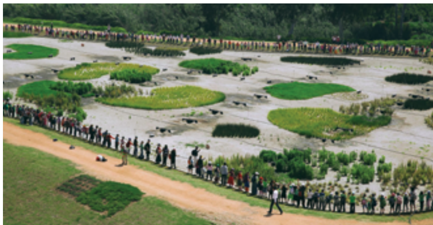
ילדי הוד השרון בפעילות חינוכית באגני האחו-לח.

נמשיך דרומה מבאר איזקסון לאורך גינת הטווס, נפנה מערבה אל רחוב פשוש ונפנה דרומה לשטח העפר שממזרח לבית ספר רבין. נמשיך עד לנקודת היציאה של נחל הדר מן התעלה. נמשיך לאורכו של נחל הדר לכיוון דרום, המרחק: כ-630 מ'. לאורך הדרך נראה את נחל הדר במופעו הטבעי, סביבו צמחיית נחל אופיינית ולצידו שטחים חקלאיים פתוחים. זהו הנוף שאפיין את ראשית היישוב העברי בתחום הוד השרון. נמשיך לאורך הנחל עד למפגש עם דרך הים עד שנגיע לפארק הוד השרון החדש, נחצה את דרך הים, ונראה מולנו את האגם האקולוגי הייחודי מסוגו. נמשיך דרומה לאורך השביל המוסדר עד שנגיע אל הפארק. אורך הדרך כ-160 מ' עד לאגם וכ-700 מ' בשביל הסובב את האגם. פרויקט האגם הוא גולת הכותרת של פארק הוד השרון. זהו שער הכניסה אל הפארק מכיוון נווה נאמן ורמתיים. על האגם, המשתרע על פני כ-30 דונמים, הוקמו שני מבני תצפיות לציפורים בסטנדרטים בינלאומיים וגשר המחבר בין שתי גדותיו.