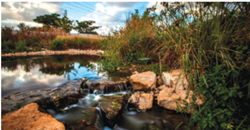
מעין נחל הדר. פארק הוד השרון.

נמשיך דרומה כ-400 מ' לאורך דרך רמתיים עד לצומת שממערבה לו רח' הבנים וממזרחה לו מגדאל. צומת רמתיים הבנים היה מוכר עד לשנות ה-90 ככיכר הנשיא וזאת מפני שעד תחילת שנות האלפיים הייתה בצומת כיכר אשר נקראה כך על שם חיים וייצמן הנשיא הראשון של מדינת ישראל. רחוב רמתיים שעד שנות השבעים היה כביש האורך היחיד באזור, העביר את התנועה מצפון לדרום. החל משנות השבעים, לאחר סלילת כביש 4 הוקמה הכיכר ובסוף שנות התשעים הוחלפה הכיכר בצומת המרומזר. הכיכר נחשבה למקום מפגש אליו הגיעו תושבים צעירים ובוגרים מהמושבות הסמוכות בין היתר באמצעות עגלות מוסעות על ידי חמורים.