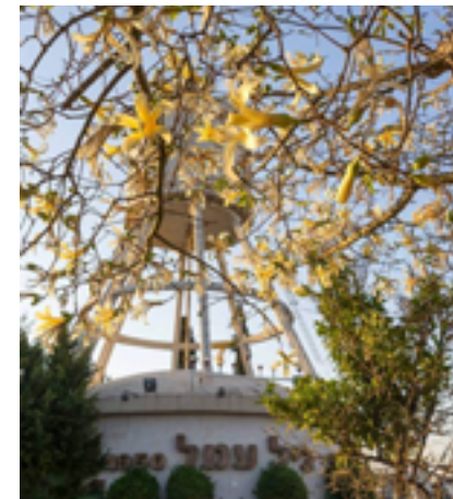
מגדל המים גיל עמל