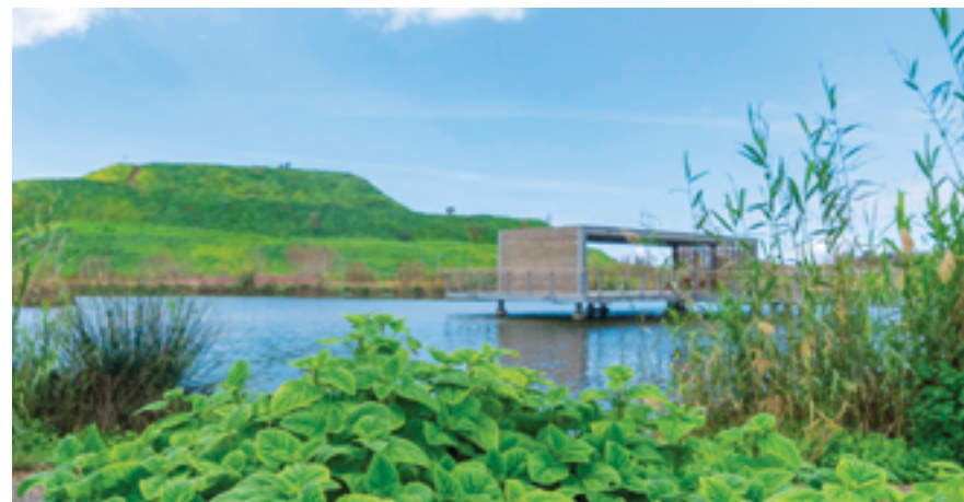
האגם האקולוגי והר הזבל. פארק הוד השרון.