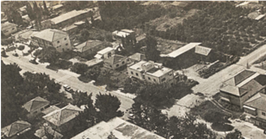
דרך רמתים. שנות ה-50.

נמשיך מערבה לאורך רח' הנשיאים עד הצומת עם רח' הדרים, ובה נפנה דרומה. נמשיך עד הצומת עם רח' האיחוד, נפנה מערבה, ובמפגש עם רח' יהשוע בן גמלא נפנה צפונה, עד יהשוע בן גמלא 60, למרחק כולל של 1,100 מ' במיקום זה פועל בתי הספר האנתרופוסופי. בשנים האחרונות מובילה עיריית הוד השרון תפיסה חינוכית ייחודית לפיה "כל תלמיד יכול" זהו חזונה החינוכי של העיר ובמסגרתו מופעלות מגוון נרחב של מסגרות בית ספריות לילדי העיר והאזור. לצד ביה"ס האנתרופוסופי הדוגל בשיטת חינוך המספקת חופש רב לתלמידים לבחור את תכנית הלימוד ואת שעות ההגעה וההליכה מבית הספר, פועלים בעיר בית ספר דמוקרטי, בית ספר לילדים עם צרכים מיוחדים, בית ספר אזורי לאומנויות, ביה"ס יוק, בית ספר לתבונת לימודי יהדות, בית ספר בשיטת היי-טק ועוד.