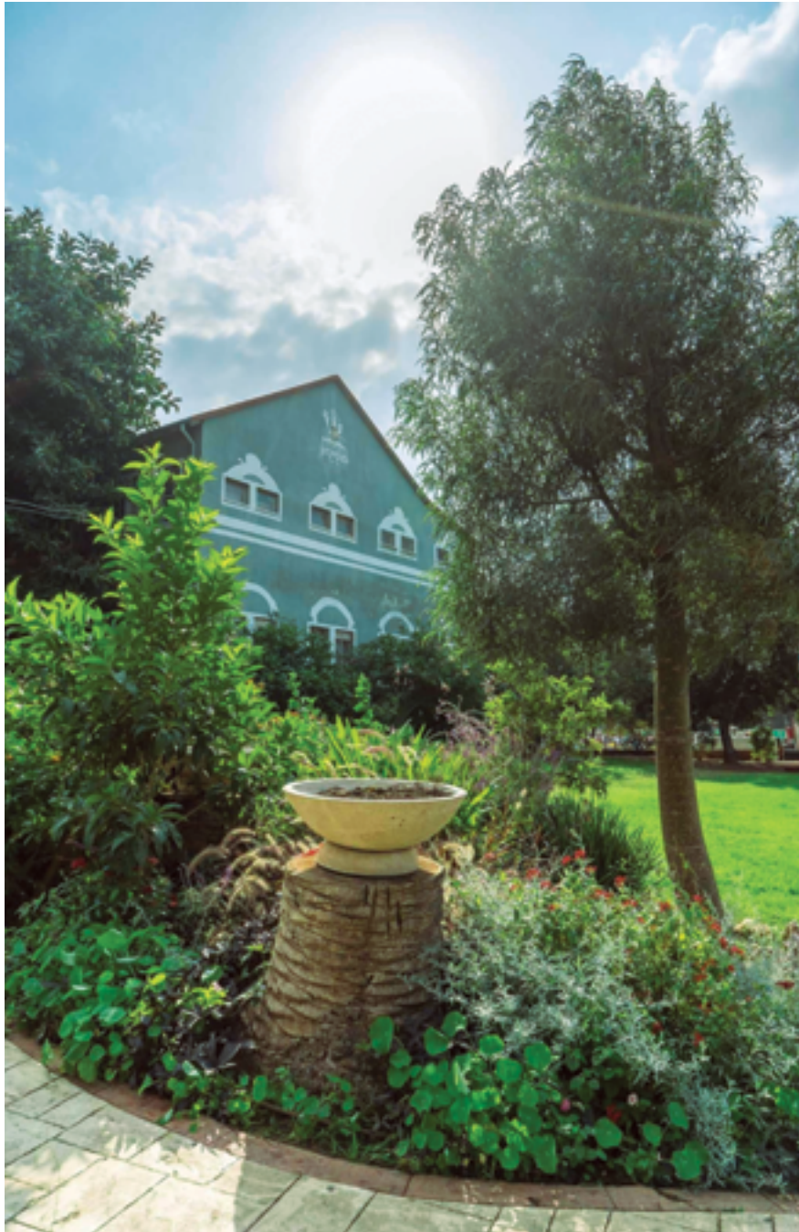
המסלול הירוק - חיים בתנועה - סיור ברחבי העיר