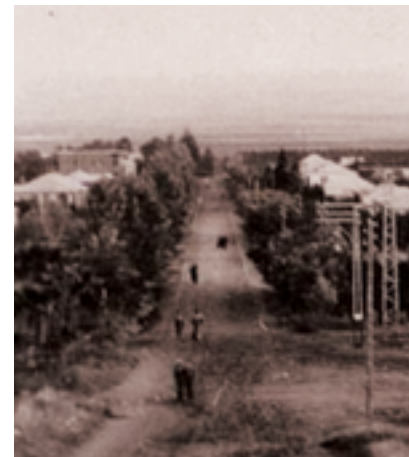
רחוב חנקין, ימי ראשית המושבה מגדיאל