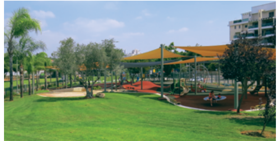
פארק כל הילדים.

בשנות ה-80 שופצה הבאר על-ידי משפחת איזקסון ולימים פסקה שאיבת המים ממנה. בשנת 2017 יזם תאגיד "מי הוד השרון" בהתאם להנחייתו