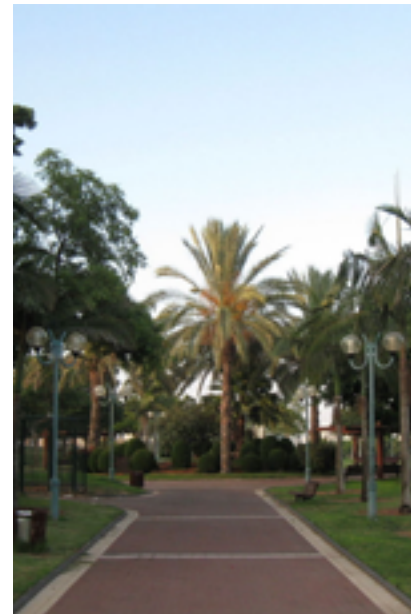
פארק 4 עונות

במפגש נחל הדר עם רחוב הפרדס המשיכו ישר אל תוך פארק ארבע העונות. בשלב זה של הטיול בוודאי תרצו לנוח מעט ולהתרווח. בפארק ארבע העונות תמצאו מדשאות נרחבות ומוצללות, ברזיות ספסלים ומתקני ספורט. הפארק המשתרע על פני כ-100 דונמים הוקם בשנת 1991 וכולל מדשאות רבות ומתקני שעשועים והוא משמש למגוון אירועים עירוניים שהבולטים בהם הם אירועי יום העצמאות ופסטיבל הביירה של הוד השרון. לנוחיות המבקרים ממוקם חניון צמוד ללא עלות. היקף הפארק הוא כ-1.5 קילומטר ובשבילים שבו ניתן לערוך הליכות וריצות ארוכות, כאשר בפנינותיו נמצאים מספר מתקני כושר עמם ניתן לשלב אימון המתבסס על משקל גוף. בשנת 2014 שודרג הפארק על ידי עיריית הוד השרון, במתחם נבנו מספר מתקנים חדישים ומהנים ובחלקו המזרחי הוקם 'פארק כל הילדים' הייחודי, הוא פארק נגישי לילדים וילידים עם צרכים מיוחדים הכולל מתקני משחק ומגרשי כדורסל המותאמים לכולם בהתאם לחזון העירוני של שילוב וקבלת השונה.