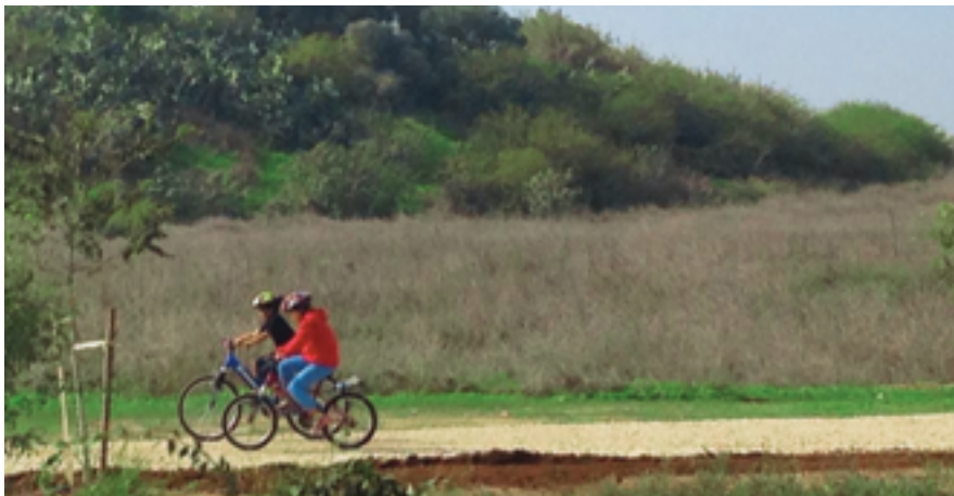
שטחי טבע עירוניים

נמשיך מזרחה לאורכו של הירקון, במעלה הזרם ועד דרך רמתיים (דרך 402), למרחק של כ-3800 מ'. הנסיעה או הצעידה לאורך הירקון היא בדרך עפר, אך יתרונותיה רבים, והיא כוללת סביבת נחל, ומים זורמים כל השנה. לאורך הדרך תראו את גשר פרוחיה-הוא גשר תורכי הרוס ולידו חניון למנוחה ופיקניק, הסכר עם מפגש נחל קנה, טחנת אבו רבאח-היא טחנת קמח שהוקמה בסוף המאה ה-19 על ידי השייח אבו רבאח, על גבי שרידי טחנה קדומה עוד יותר. בשנת 1913 הוקמו בה שתי טורבינות מודרניות לתקופתם שהפעילו שבע זוגות של אבני ריחיים. אלו פעלו עד מלחמת השחרור. בהמשך הדרך תראו שרידים של ניסיונות התיישבות על גדת הירקון משנת 1880, על ידי יהודים מירושלים ומפתח תקווה, הצפות ומחלת הקדחת אילצו אותם לעזוב.