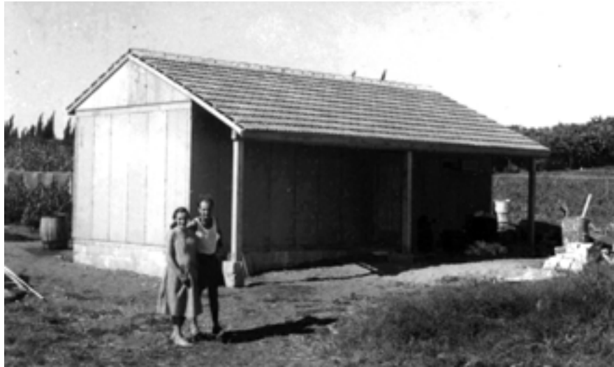
כפר הנוער בשנות ה-40.

מבנה המועדון היו מבנה נוסף הנמצא במתחם מוסינזון, זהו מבנה מטויח בן קומה אחת עם גג רעפים. המפתחים מרובעים, בחזית סככה מחומרים קלים. בסמוך לו עץ שניצב במקום כבר בשנות ה-40 וייתכן שניטע על ידי חברי קבוצת ההכשרה. זהו אחד המבנים האחרונים שנותרו מן הגרעין המבונה הראשון של המוסד. ייתכן שאחד המבנים האחרונים שנותרו מימי קבוצת ההכשרה שישבה במקום בשנות ה-30 וה-40. בסמוך למבנה זה מספר עצים הפזורים במעין כיכר בין מבני ביה"ס ונראה שהעצים הינם אחד השרידים האחרונים שנותרו מן המתחם של קבוצת ההכשרה.