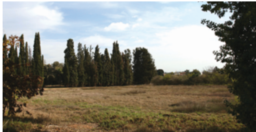
בית הנערה. בית שיפר.