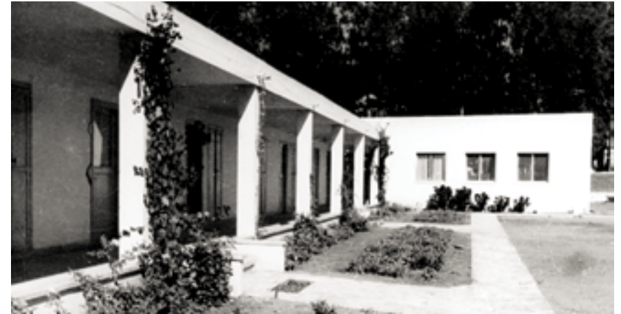
כפר הנוער מוסינזון.

המבנה המרכזי במתחם הוא בית רתבון אשר נועד לשמש כבניין המרכזי במוסד. המבנה תוכנן על ידי האדריכלית ז'ניה אוורבך ונבנה בשנת 1949. הבנייה מומנה על ידי עליית הנוער מקרן אלינור רתבון ועל ידי הקרן של המפעלים הקונסטרוקטיביים של הציונות הכללית. נראה כי הבניין כלל במקור 8 חדרי כיתות, 4 חדרי מעבדות עם 4 חדרי עזר, אולם להריצאות ולמטיבות עם במה, חדר קריאה וחדר ספרייה, חדר מורים ומשרדים. ייתכן שחלק מפונקציות אלו תוכננו להיבנות בשני מבנים סמוכים שנכללו בתכנית. זהו מבנה מטויח בן 2 קומות עם גג רעפים. בקומה הראשונה של הבניין חדרי משרדים ואולם. בקומה השנייה כיתות לימוד ושירותים. המפתחים מרובעים. חלונות המבנה מעוטרים בעיטורי טיח. בחזית הקומה הראשונה גגון משופע הנסמך על שורת עמודים.