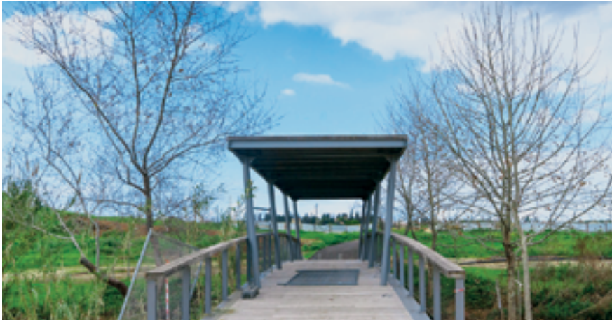
פארק האקולוגי הוד השרון

נמשך ממגדל המים לכיוון רחוב אפק וברחוב אפק לכל אורכו לכיוון מערב, עד רחוב דרך רמתיים, ומשם מזרחה על דרך הים עד נחל הדר. נרד בשביל אורך תוואי הנחל לכיוון דרום, מדובר בהליכה חווייתית הנמשכת על פני כ- 1600 מטרים. נחל הדר הינו כאמור אחד מ-4 הנחלים בתחומי העיר: הדס, הדר, פרדס וקנה המיועדים להחייאה ושיקום כנחלים זורמים במרחב העירוני ובישובים הסמוכים. הנחלים נמשכים על פני אורך כולל של 22 ק"מ ולאורכם מתוכננת שימורה של רצועה ירוקה ופתוחה ברוחב כ-100 מטרים אשר תהווה תוספת לשטחיה הירוקים של העיר ותאפשר הנאה ממרחבי הטבע והפנאי בסמיכות לאזורי המגורים השונים בהם עוברים הנחלים. הזרמת מים מושבים לאורך השנה כולה, ברמה שלישונית, היא הרמה הגבוהה ביותר הכוללת ליטוש באגני האחו-לח עליהם נפרט בהמשך, הופכת את נחל הדר לנחל חי, משוקם ומשוחזר כנחל טבעי תוך החזרת המורפולוגיה של נחל זורם ומתפתל בטבעיות בשטח המישורי. מבנה הנחל כולל שיפועי גדות משתנים ליצירת