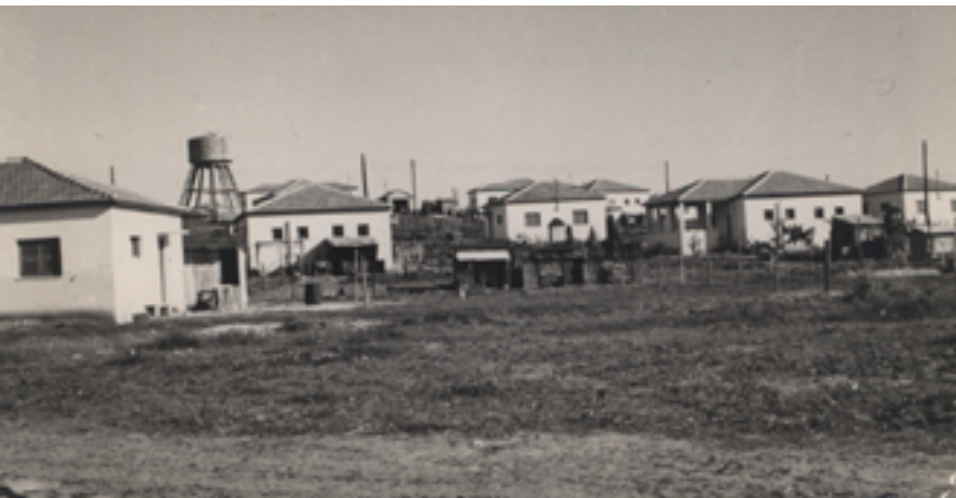
נווה נאמן ומגדל המים בעבר.