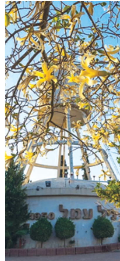
מגדל המים גיל עמל. שומר בשנת 2008

ביטוי ליופיו. בנוסף למגדל, נבנה בסמוך מעגל תנועה מרשים ובמרכזו ניטע עץ זית עתיק.