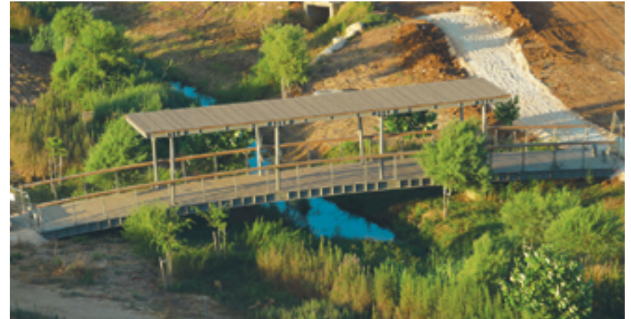
גשר נחל הדר