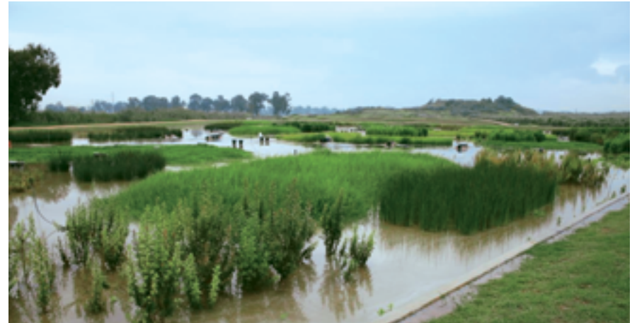
אגני האחו לח

נמשיך דרומה במורד נחל הדר לכיוון הירקון לאורך כק"מ. שם נפגוש בגשר החיבור שבין נחל הדר לנחל הירקון ובהמשך במכון שאיבה - זהו מתחם פרדס בחריה. פרדס בחריה ניטע במהלך שנת 1905 והשתרע על פני כ-600 דונמים משני צדי נחל הדר ונחל הירקון. במשך השנים היה זה הפרדס הגדול בארץ בבעלות יהודית. קרוניות הפרי הוסעו על גבי מסילות, אשר חצו את הנחל על גבי גשר. כיום משמש הגשר להולכי רגל מעל לנחל. מבנה מורכב מעמודי בטון עליהם הונחו קורות ברזל וככל הנראה, על הרלסים הונח משטח עשוי ברזל ועץ וכי על המשטח הוזה יצקו משטח בטון. לגשר חשיבות נופית וסביבתית רבה, הגשר הינו חלק ממתחם פרדס בחריה, אחד ממרכיבי מרחב טבע, נוף מורשת, וחלק משביל ישראל. חשיבותו ההיסטורית בכך שהגשר הינו עדות למורשת הפרדסנות ששימשה בסיס להתיישבות באזור השרון בכלל ובעיר הוד השרון בפרט. בסמוך ממקום מכון שאיבה וזאת כחלק מהגן הלאומי שבמתחם. זהו מכון שאיבה ההיסטורי היחיד בתחומי הוד השרון והוא חלק מפרדס בחריה. המבנה קיים אך מכוסה לגמרי בצמחייה.