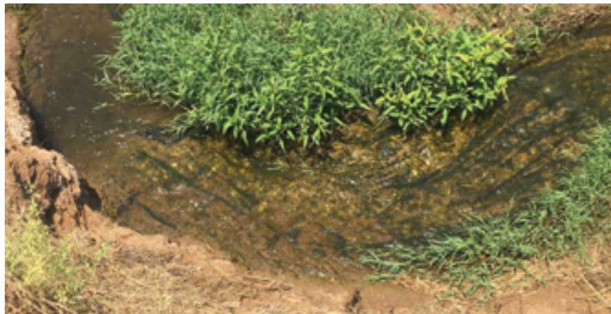
נחל הדס זורם