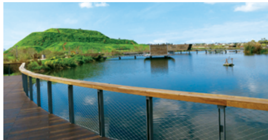
אגם פארק הוד השרון

מדובר במימוש של החזון העירוני ובתרומתה של העיר הוד השרון לפרויקט הלאומי לגאולת הירקון. הנחלים הזורמים, האגם האקולוגי והפארק סביב לו יהיו לאתר טבע עירוני ייחודי בישראל. שילוב האגם בפארק הנחל המשוקם בקרבת אזור התעשייה נוה נאמן יוצר ממשק אורבני חי בין אזור התעשייה המורחב ממזרח, לבין הפארק.