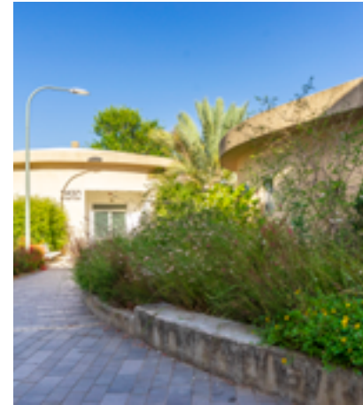
בריכת האגירה כיום

המסלול הכחול - טיול לאורך תוואי המים העירוני