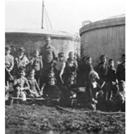
בריכת האגירה גבעת הכיבוש. 1930